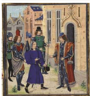
Prise de Jugon par Charles de Blois, détail (1342). Jean Froissart, Croniques . Loyset Liédet, enlumineur.