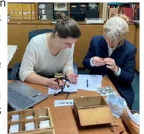
Identification, classement et inventaire des monnaies antiques du cabinet du CIS.