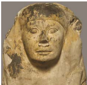
Détail de la tête du sphinx JE 3513.