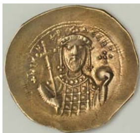
Monnaie d'or ( nomisma histaménon ) à l'effigie de Nicéphore III Botaneiatès (1087-1081).