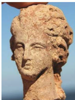
Tête de figurine en terre-cuite trouvée dans le quartier des colons, îlot de Nelson, baie d'Aboukir, VI e -III e s. av. J.-C.