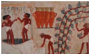
En haut : hydrie de Hadra, nécropole ptolémaïque de Plinthine, musée gréco-romain d'Alexandrie ; en bas : tombeau de Nakht, scène de fouillage.