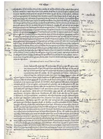
0Apanta ta; tou Jppokratou-. Omnia opera Hippocratis , Venise, Aide, 1526, UB Göttingen 4 o Cod. mss. hist. nat. 3, f. 216.