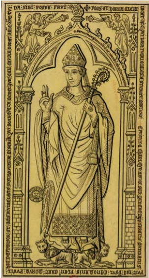
Dalle funéraire sur plaque de cuivre jaune de Jean de Chanlay (BnF, Est., Rés. Pe 1 o, fol. 28).