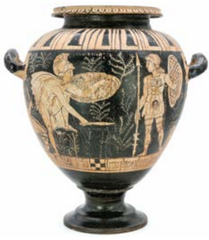
Stamnos de la tombe Lattanzi de Norchia : Ajax Télamon, à droite, et Achille, à gauche (R. Bernadet).