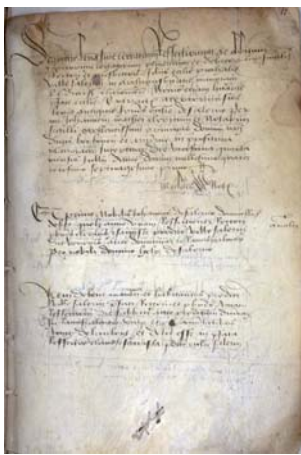
Le début de la liève, Clermont, bibliothèque municipale, ms. 652, p. 11.