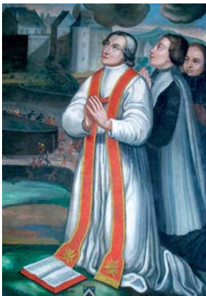
Le curé de Salers et deux prêtres filleuls, détail du Vœu de la ville de Salers de 1586, retable d'autel, XVII e siècle, Salers, église Saint-Mathieu.