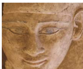
Détail du sarcophage découvert dans la tombe AGH038.