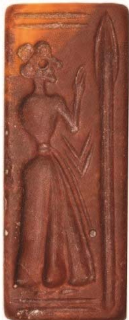
Sceau en jaspe rouge de la nécropole de Petras (Crète).